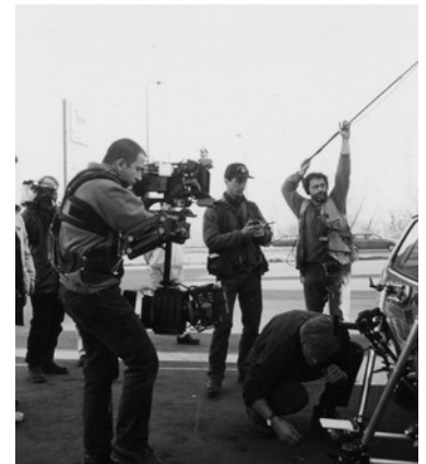
Realtà finanziata al lavoro