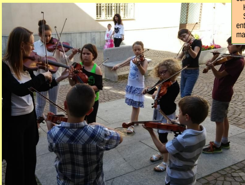
associazione Opificio musicale

Dunque, per l'esercizio 2024 la speranza è quella di approdare ad un sostanziale pareggio contando nella capacità della nostra cooperativa di sviluppare azioni sociali e commerciali in grado di rinnovare l'interesse in chi è già socio e di attrarre di nuovi.