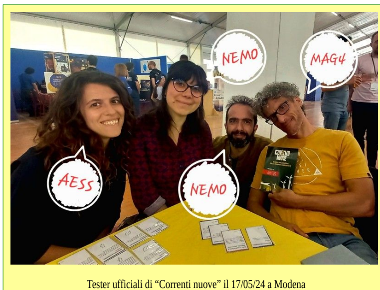
Tester ufficiali di "Correnti nuove" il 17/05/24 a Modena

Sfidante, dite? Allora siete pronti a sedere al tavolo con noi (o forse siete già pronti a fondare una CERS)!