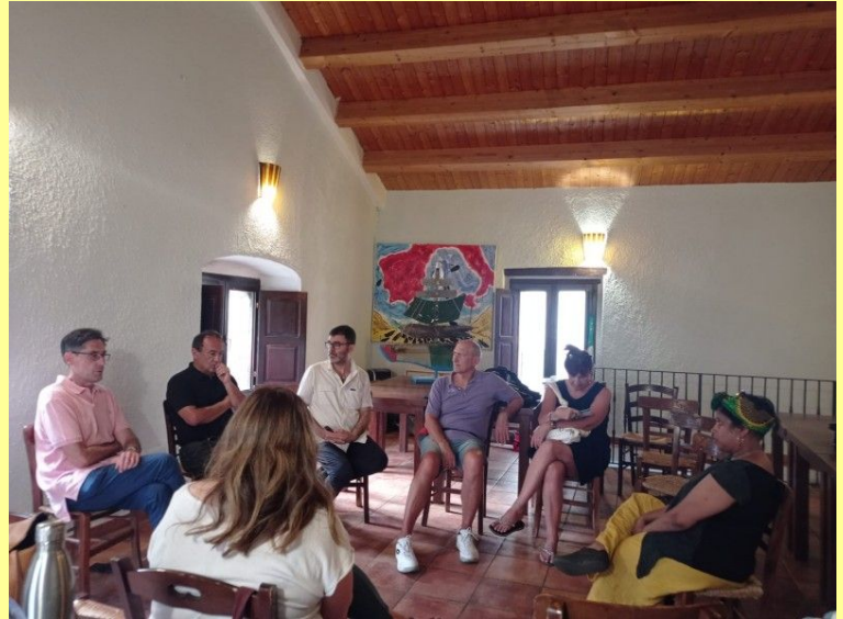
Coordinamento MAGico del 23 e 24/06/23 a Riace e Camini (RC)

Insomma, questo viaggio di scrittura comunitaria ci ha portato a stringere e ritrovare i rapporti umani tra le persone che compongono le MAG, ma anche ad alimentare il desiderio di provare a muoverci come realtà collettiva, certo con le sue peculiarità territoriali: un percorso di crescita e formazione reciproca per avere più visibilità e incisività!