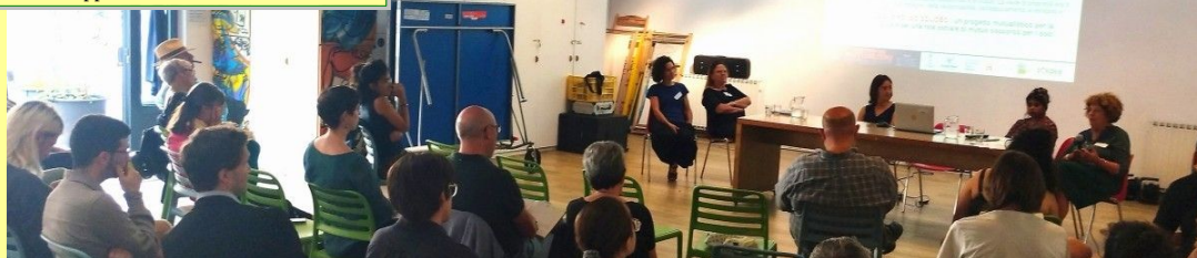
Carovana dei mutualismi: tappa in via Baltea

Mutualità è anche cultura del Mutualismo, con origini rintracciabili fin dalla fine dell'800 nella ricerca delle tutele necessarie delle classi lavoratrici in tempi in cui non vi erano tutele universalistiche. Per sviluppare una nuova cultura del mutualismo la società di Mutuo soccorso Solidea si è dotata di uno strumento editoriale, della Rivista Solidea https://www.mtuosoccorsosolidea.org/la-rivista/ che tratta dei temi del lavoro, del mutualismo e delle comunità in un intreccio virtuoso di nuove pratiche e di innovazione sociale.