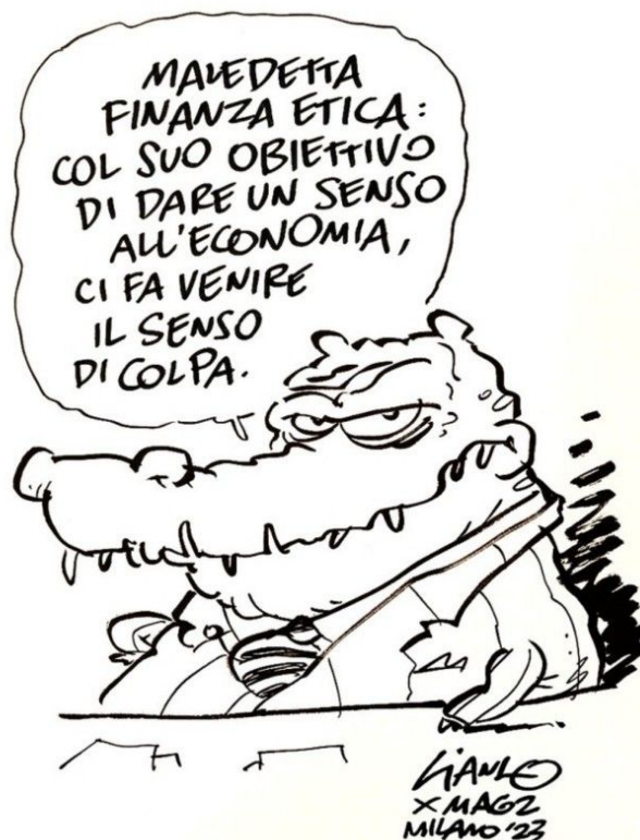
Gianlo x MAG2