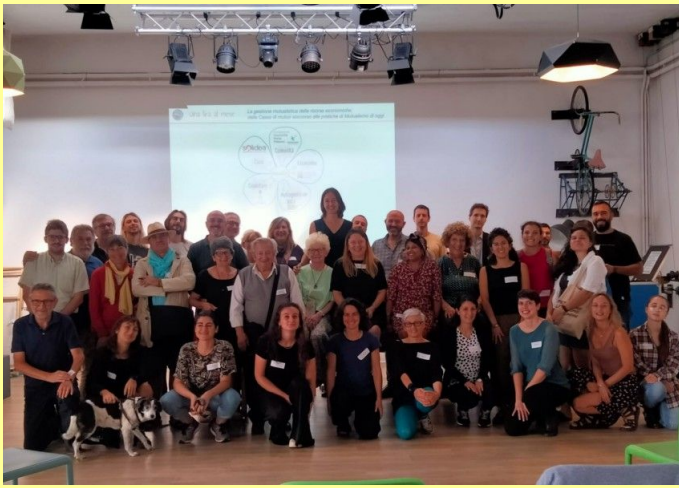
Carovana dei mutualismi: tappa in via Baltea

- Campagna di azionariato popolare 100x10.000 lanciata dalla cooperativa GFF creata dal Collettivo di fabbrica dell'ex GKN per creare la prima fabbrica pubblica e socialmente integrata .