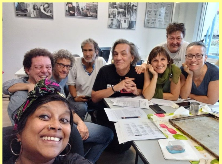
Consiglio di amministrazione 2023-2026

E' possibile leggere il verbale nell'area riservata soci a questo indirizzo https://www.mag4.it/materiali-soci/category/157-verbali-assemblee.html previo login.