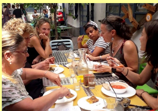
Carovana dei mutualismi: tappa in via Baltea

Prendersi cura delle persone, dei territori, dei lavoratori è l'obiettivo del progetto mutualistico di queste due realtà, che si inseriscono a pieno titolo nell'alveo del Terzo Settore e nelle risposte che il non profit costruisce per rispondere a bisogni sociali e sanitari.