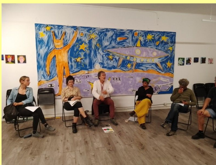
Assemblea dei soci il 14/07/23 a Torino

Nota bene: ciascun socio non può ricevere più di 10 deleghe da altri soci, dovranno astenersi dalle votazioni i soci iscritti alla cooperativa da meno di tre mesi e non possono ricevere delega di rappresentanza gli amministratori ed i dipendenti.