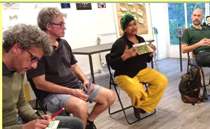
Assemblea dei soci il 14/07/23 a Torino