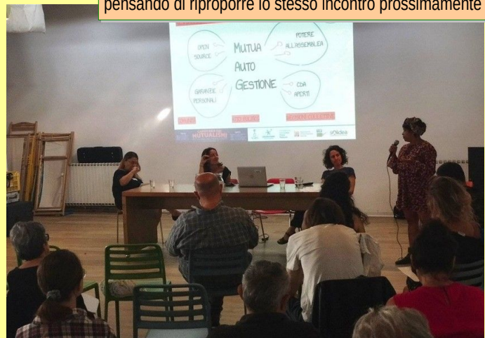
Carovana dei mutualismi: tappa in via Baltea