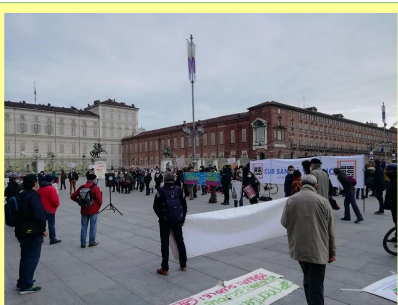
Presidio torinese del 21/11/20

Hai una cellulare? Facci avere il tuo numero scrivendo ad amministrazione@mag4.it . Lo useremo solo per mandarti un promemoria in occasione di eventi e riunioni organizzati dalla cooperativa. Hai anche un profilo Facebook? Allora metti 'mi piace' alla pagina della MAG4 https://www.facebook.com/mag4piemonte e aiutaci a diffonderla e a condividerla tra i tuoi amici. La aggiorniamo con articoli interessanti e iniziative dei soci e ci serve anche il tuo supporto per raggiungere più persone possibili!