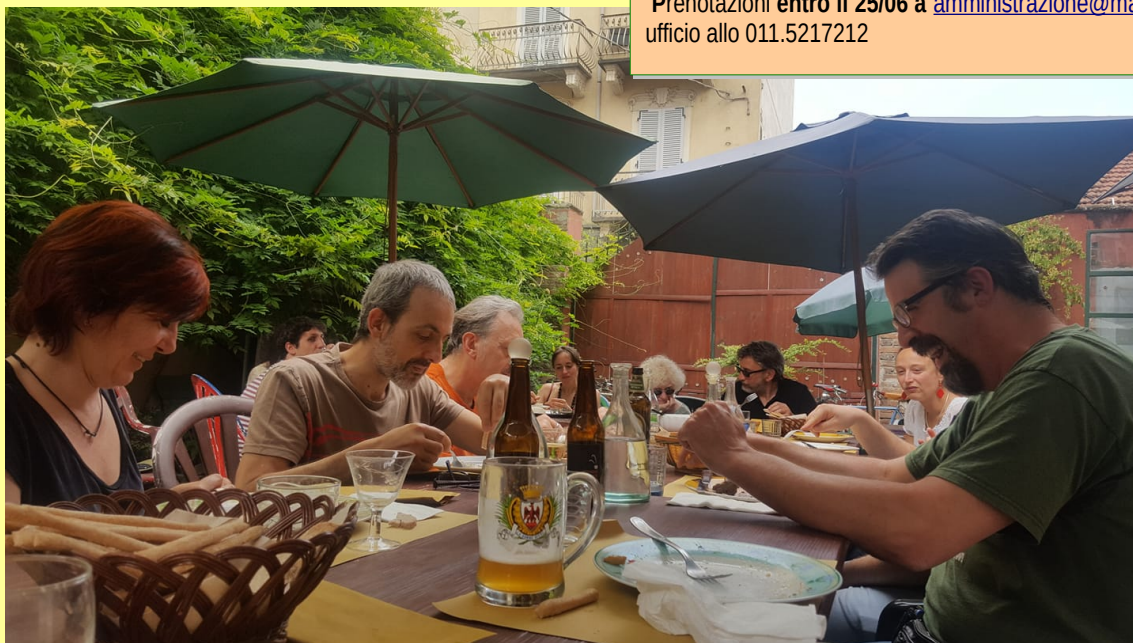
Esperienza pratiche di autogestione – pranzo Molo di Lilith 16/05/2018

Prenotazioni entro il 25/06 a amministrazione@mag4.it oppure chiamando in ufficio allo 011.5217212