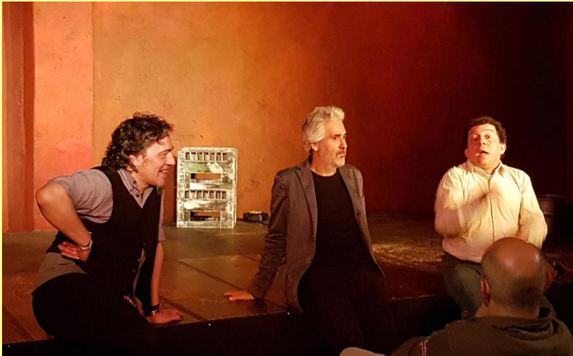
Bit coin e monete complementari: due facce della stessa moneta? Molo di Lilit 16/05/2018

approccio molto prudentiale che spiega perché i preventivi sono di solito sottostimati rispetto ai preventivi.