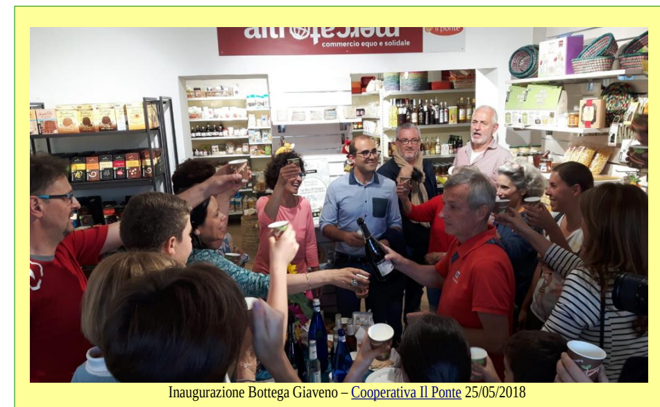
Inaugurazione Bottega Giaveno – Cooperativa Il Ponte 25/05/2018

La proposta della modifica del regolamento https://www.mag4.it/scaricamenti/statuto.html è