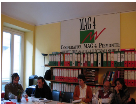
Coordinamento MAGico a Torino