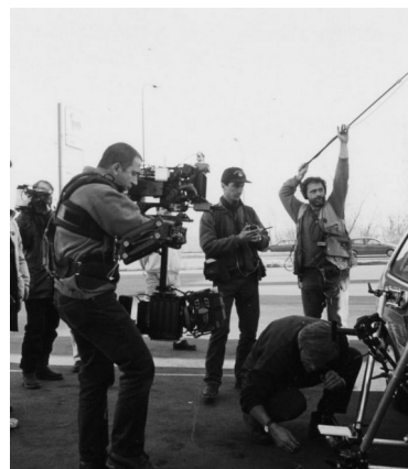
Realtà finanziata al lavoro